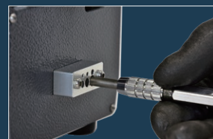
• チップフラットブロック